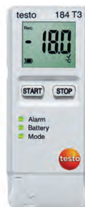
testo 184 T3