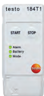
testo 184 T1