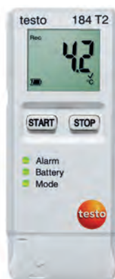
testo 184 T2