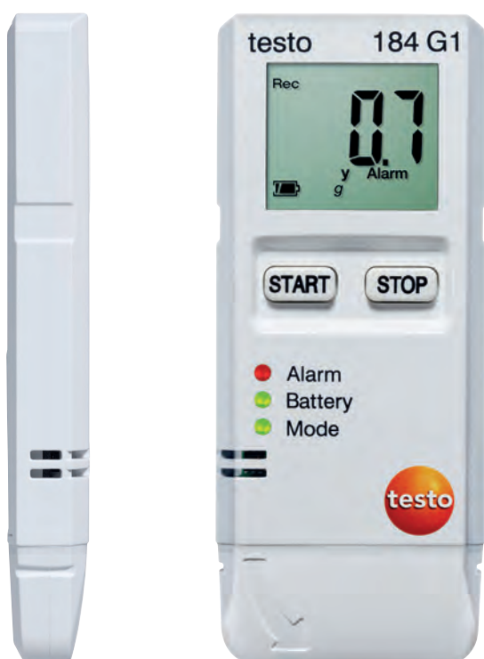
Zobrazení ve skutečné velikosti.

Přehled všech výhod záznamníku testo 184.